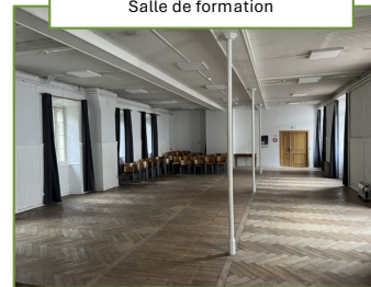
Salle de formation

Les sanitaires sont partagés, dans une ambiance de colonie de vacances, avec des douches individuelles fermées et des lavabos en enfilade collectifs.