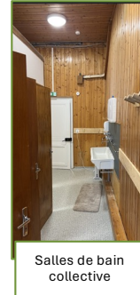
Salles de bain collective

Les sanitaires sont partagés, dans une ambiance de colonie de vacances, avec des douches individuelles fermées et des lavabos en enfilade collectifs.